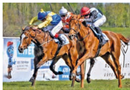
■ Most 18. 4. Devoir Rien druhá