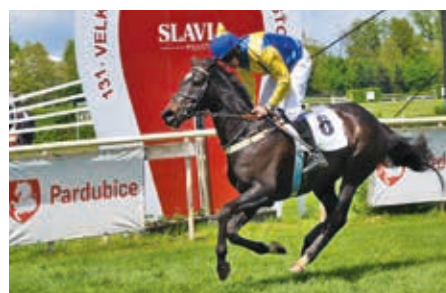
■ Pardubice 22. 5. Cheminée