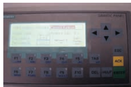
■ Proplachovací jednotka