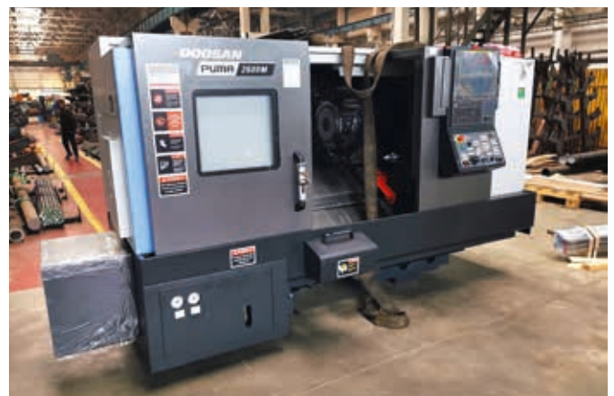
■ První dva objednané stroje dorazily do Bardejova.