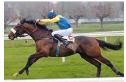
■ Roncal, PREMIO GIULIO BERLINGIERI, 14. 11. 2020