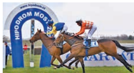
■ Most 18. 4. Devoir Rien první

Přípravil: Jiří Franc, foto: Bohumil Křížan