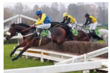
■ Northernly Wind, GRANDE STEEPLE CHASE, 14. 11. 2020