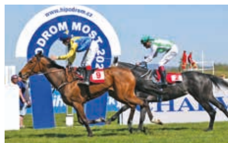
■ Most 9. 5. Faliraki