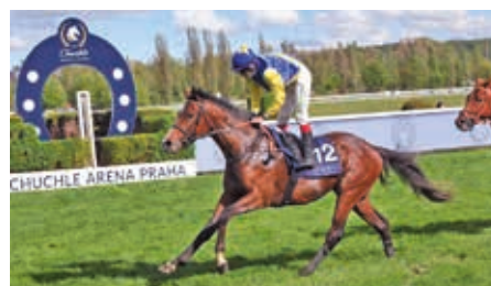
■ Praha 16. 5. Hazarder