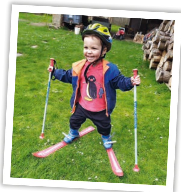
■ Až se zima zeptá, co jsi dělal v létě