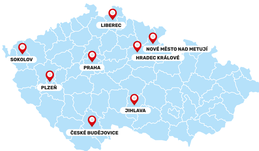
■ Aktuální rozmístění provozoven HYDROFLEXU před změnami