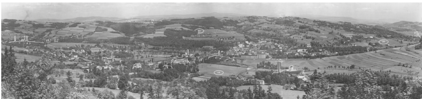
■ Místa spjatá s válečnou výrobou v Semilech, grafika MPG Semily

vzpomínek, zapomnění a záhad. Takže vás to přivede k intenzivnímu studiu historických pramenů, abyste se dozvěděl víc. Na knižce jsem intenzivně pracoval dva roky s tím, že tomu předcházela nějaká příprava.