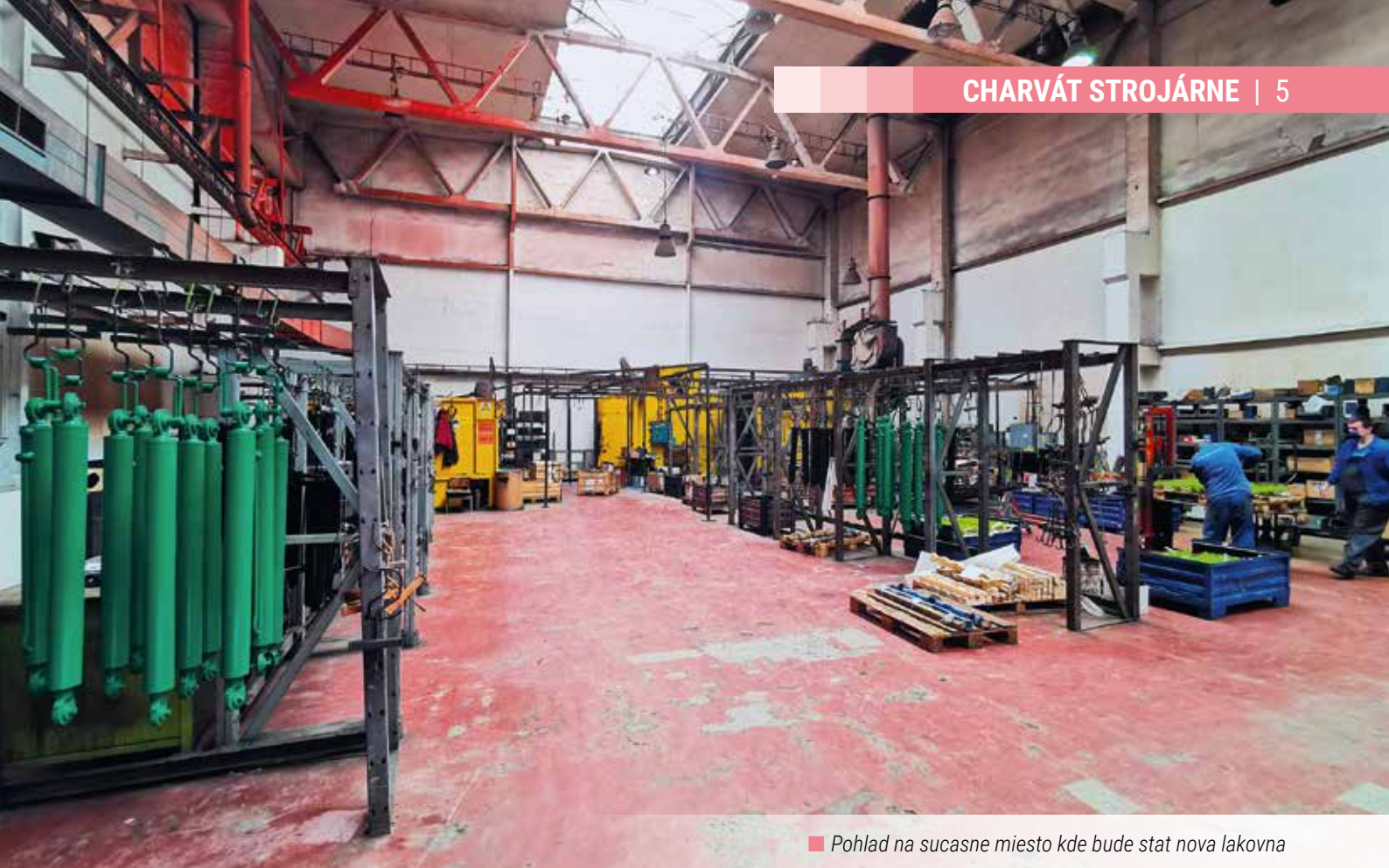
■ Pohľad na súčasne miesto kde bude stat nova lakovna