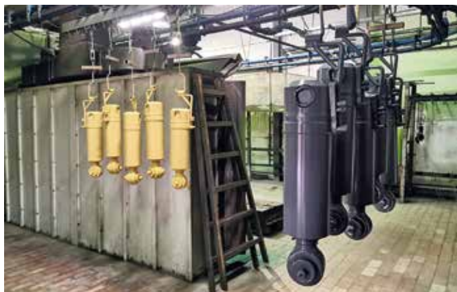
■ Sucasna lakovna