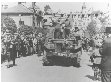
■ Příjezd Rudé armády do Semil 10. 5. 1945