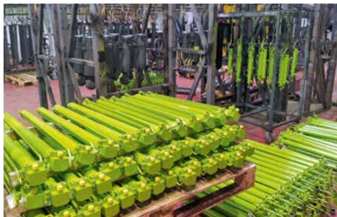
■ Hydraulické valce Claas na lakovni