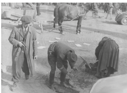
■ Dobová popiska zní Čistá rasa při práci, sbírka MPG Semily

Tomáše Chvátala se dotazoval Jiří Franc, foto ze křtu knihy Jiří Franc, archivní fotografie zaslal Tomáš Chvátal