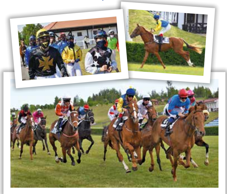
■ Letošní první zahajovací dostih v Mostě 18. května

Na závodiště bude vpuštěna POUZE osoba, která ten den bude ve výkonu práce. Majitelé a diváci nebudou vpuštěni. Průkazky vydávané Jockey Clubem ČR nebudou ke vstupu platit. U vstupu budou jména těchto osob (trenéru, jezdců a apod.) napsaná na seznamu, dostanou barevný pásek a vstup jim bude umožněn pouze do určitých sektorů na závodišti. Trenér nebo jezdec, který ten den nemá svého koně uvedeného na startovní listině nebo nejzdí, nebude vpuštěn.