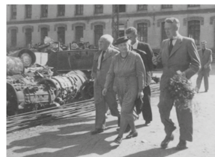
■ Tajemné předměty na dvoře továrny v Semilech - Řekách