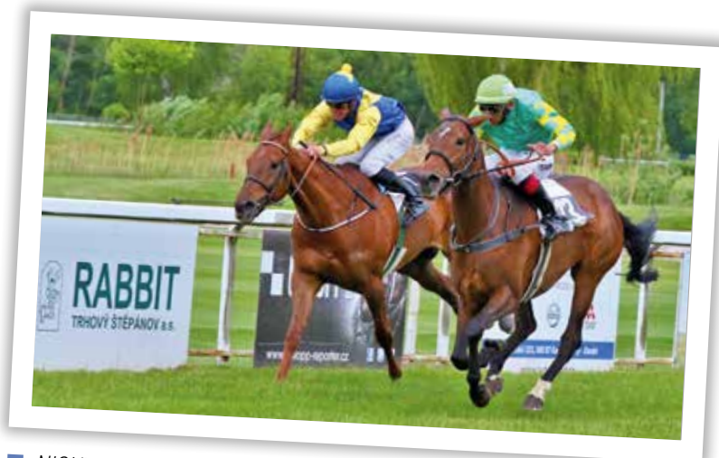
■ NIGHT MOON v souboji před cílem