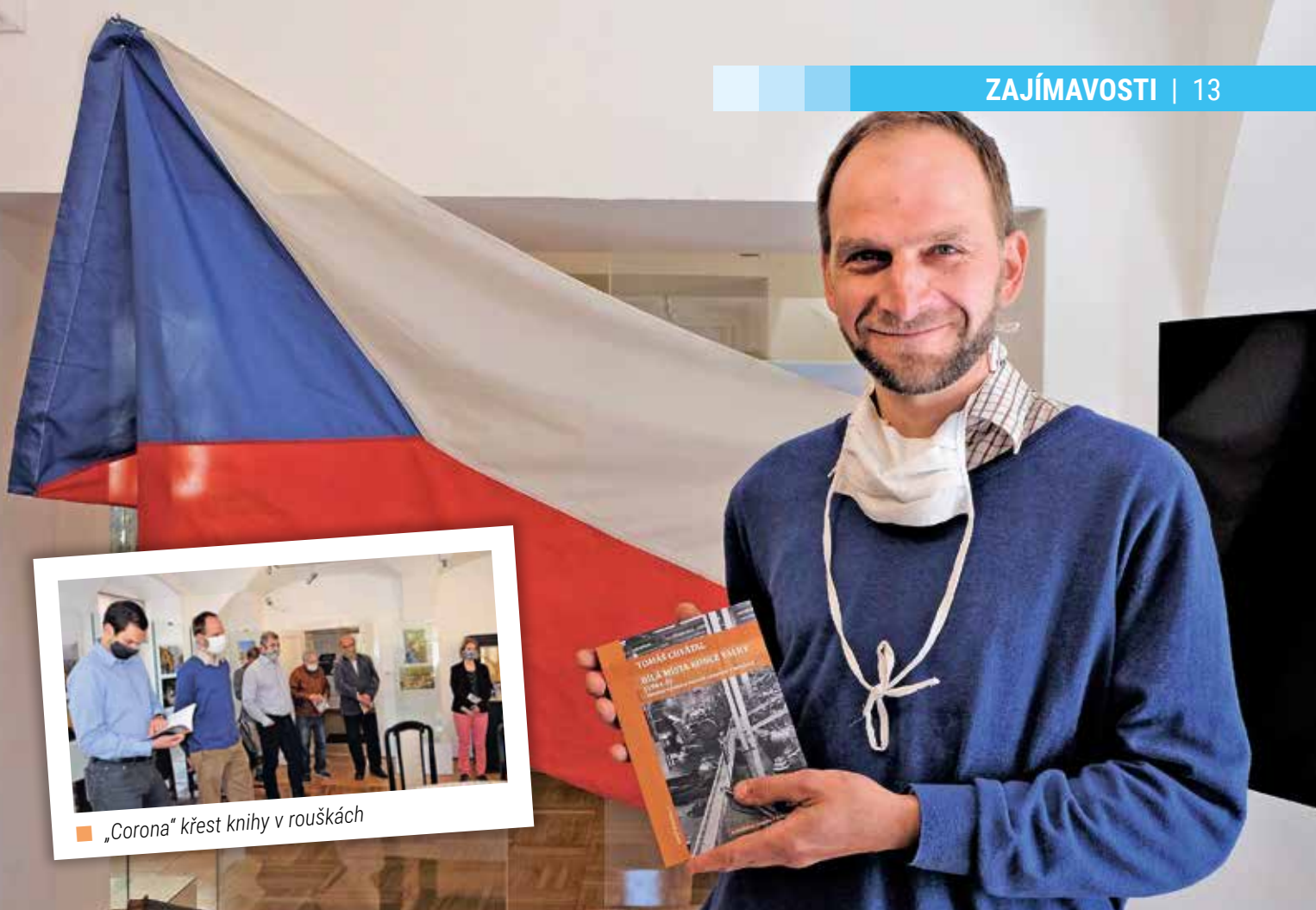
„Corona“ křest knihy v rouškách