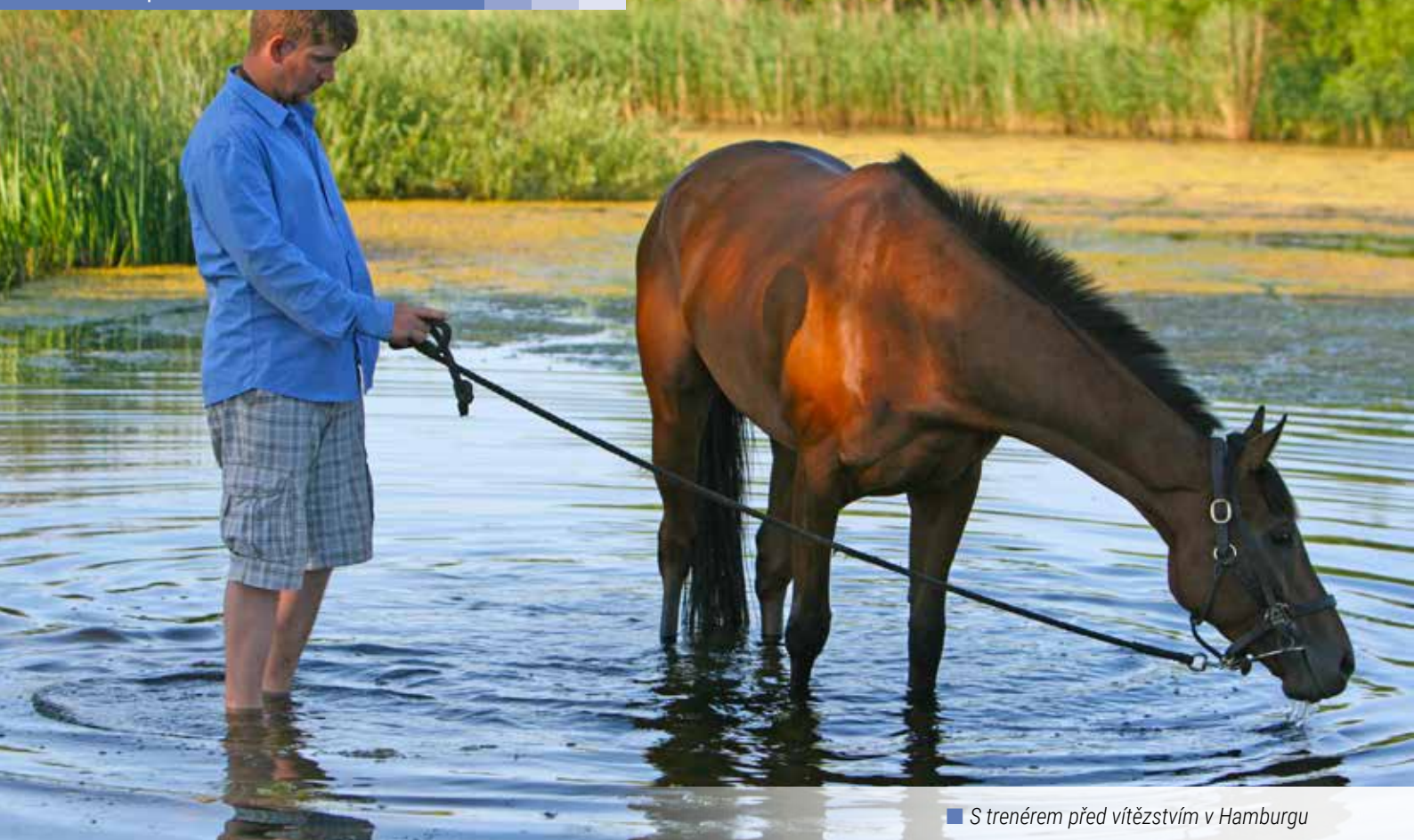
■ S trenérem před vítězstvím v Hamburku