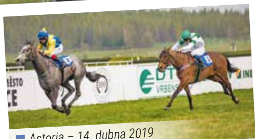
■ Astoria – 14. dubna 2019