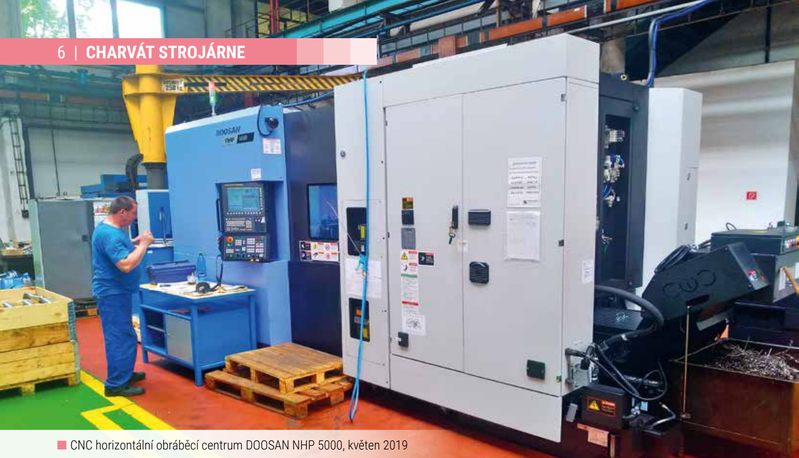
■ CNC horizontální obráběcí centrum DOOSAN NHP 5000, květen 2019