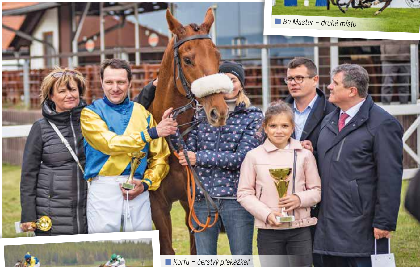
■ Korfu – čerstvý překážkář