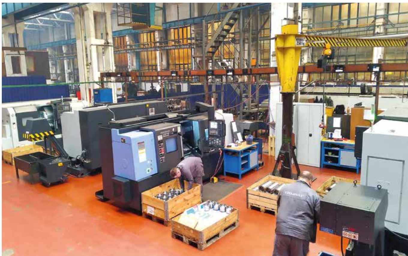
■ pohled do výrobní haly na nové stroje pořízené v r. 2018

V pořadí druhá investiční etapa má již své reálné obrysy. Jedná se o nákup celkem devíti strojů, z toho sedmi soustruhů a dvou obráběcích center. Nákupy proběhnou v závěru roku 2019, další pak v roce 2020.