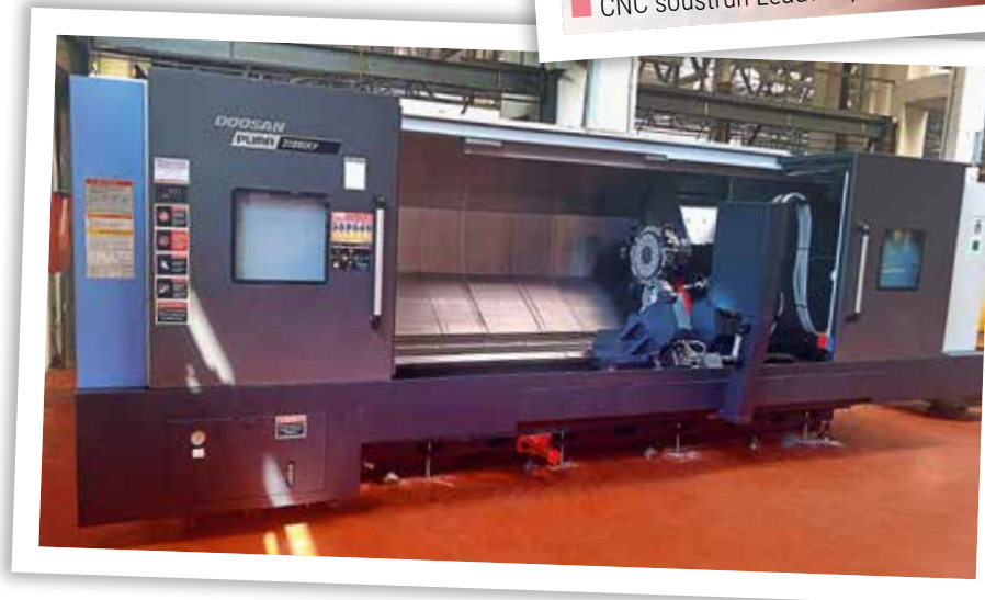
■ CNC soustruh DOOSAN PUMA, duben 2019

Pokud se týče prvního soustruhu, PUMY DOOSAN, tak ten již pracuje od poloviny května a vyrábí se na něm první dílce hydraulických válců pro firmu LIEBHERR. Druhý soustruh, NHP 5000, je již rovněž nainstalovaný,