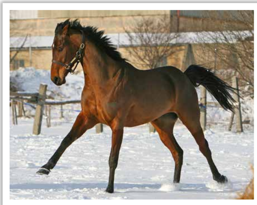
■ Trip to Rhodos zima 2013

soupeřům pár délek a ve finiši od nich lehce odešel. Jak se mělo později ukázat, bylo hnědákově poslední vítězství před českým publikem. O dva týdny později doběhl v Ceně prezidenta republiky třetí a následujících pět sezón se pohyboval už jen na zahraničních drahách. Posledním startem ve střední Evropě bylo vítězství ve Velké ceně Slovenska 2015.