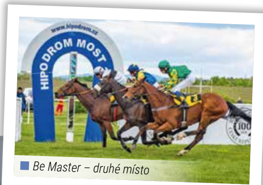
■ Be Master – druhé místo

Přinášíme přehled hlavních úspěchů našich koní. Na protější straně informujeme o průběhu I. kvalifikace na 129. Velkou Pardubickou a na poslední stranu Magazínu jsem umístili informaci o nadějném tříletém ryzákovi NIGHT TO MOON. A je samozřejmě třeba připomenout, že na svůj první dostih stále ještě čeká devět dvouletků, na jejichž výsledky je vypsána zaměstnanecská tipovací soutěž. Nu a nyní se podíváme na to, co se odehrálo letos na jaře v Mostě.