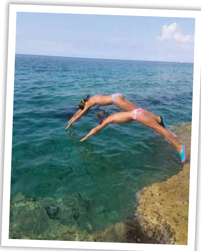
■ Josef Šíma, provozovna Brno: Výcvik delfínů, 2018

Těšíme se na vaše první fotografie!!! Soutěž byla právě odstartována.