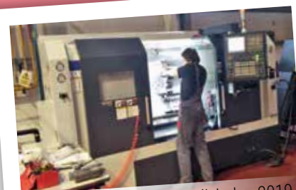
■ CNC soustruh Leadwell, leden 2019

Květen: Obráběcí centrum – unikátní nákup v rámci skupiny