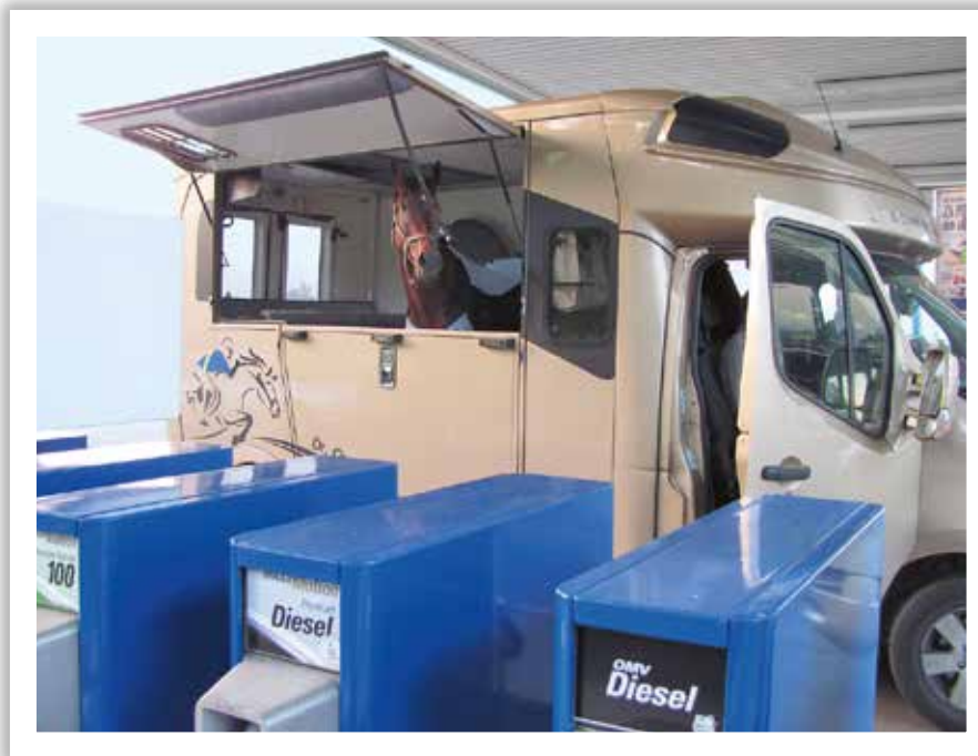
■ Přestávka na občerstvení